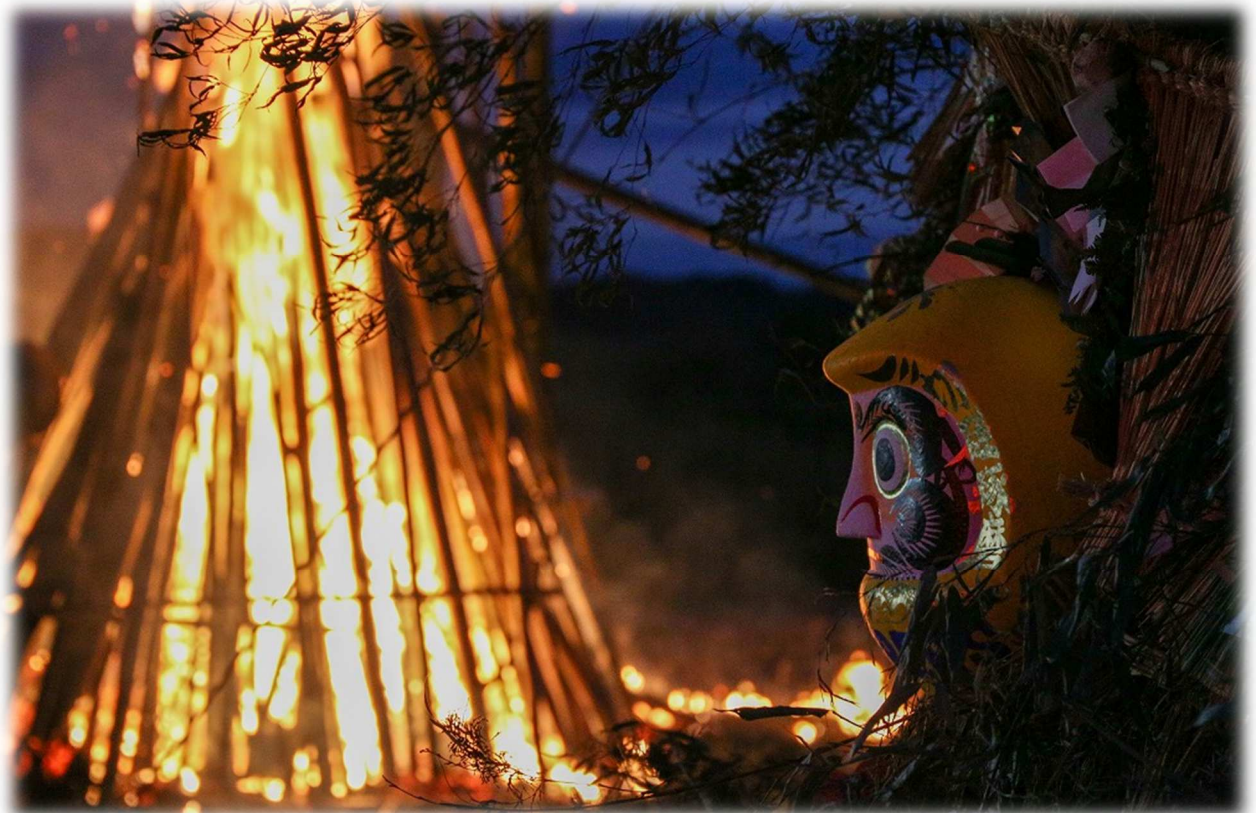
富津市どんと焼き『一年を願う』