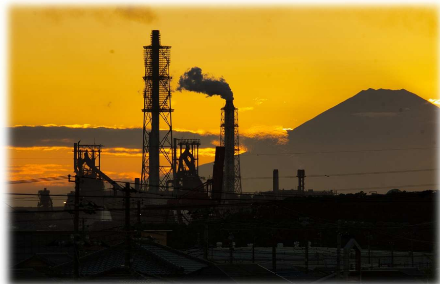
(峯薬師からの夕焼け)

君津支部青年委員会では、こういった展示会への補助も積極的に実施していきますので、ご興味ある展示会がありましたら、青年委員会/田村までお気軽にご一報いただければと思います。